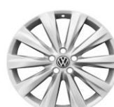
Легкосплавные колеса "Las Minas" 6J x 16 Опционально для Status и Exclusive