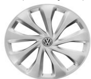
Стальные колеса 6J x 15 Стандартно для Origin и Respect