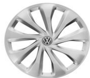
Стальные колеса 6J x 15 Стандартно для Origin и Respect