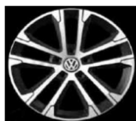
Легкосплавные диски «Singapore» Volkswagen R, 7 J x 17, (PJC)